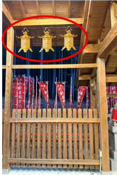
中（高さ：約 41 cm） 場所：稲荷社覆屋両側 1 基 30 万円 募集 6 基