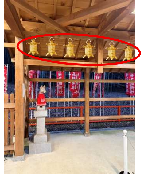
小（高さ：約 36 cm） 場所：稲荷拝殿両側 1 基 20 万円 募集 32 基