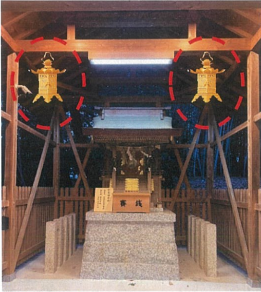
大（高さ：約 54 cm）