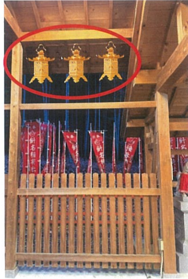
中（高さ：約 41 cm）